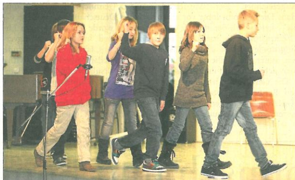
Die Sechstklässler gestern Nachmittag bei der Generalprobe. Die Aufführung ist heute Abend.

Die Aufführung beginnt heute, 7. Dezember, um 19 Uhr in der Aula der Gesamtschule (Dörnweg 53). Der Eintritt ist frei. Weitere schulinterne Aufführungen und Vorstellungen für Kinder der Hartmutschule folgen.